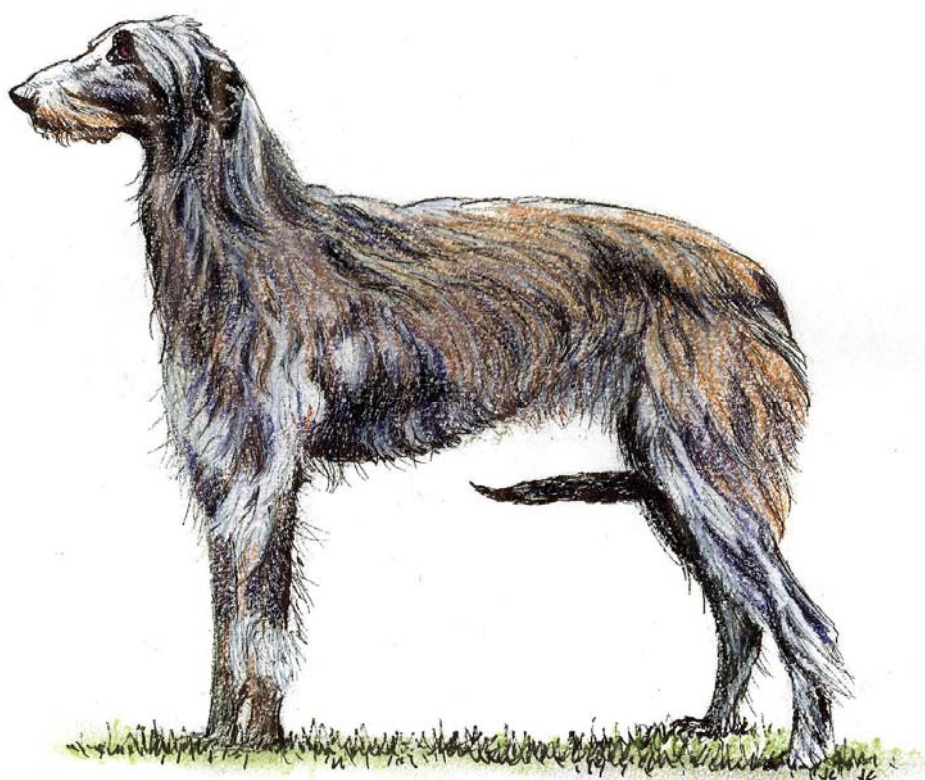
CHART SZKOCKI (Deerhound)